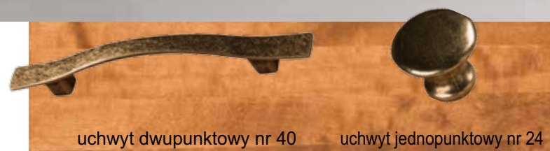
uchwyt dwupunktowy nr 40