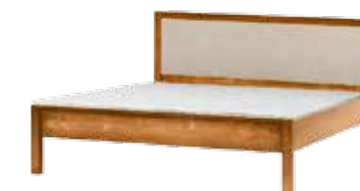
łóżko 140x200 BL141 łóżko 160x200 BL161 łóżko 180x200 BL181 szer./głęb./wys. szer./głęb./wys. szer./głęb./wys. 147/213/95 167/213/95 187/213/95