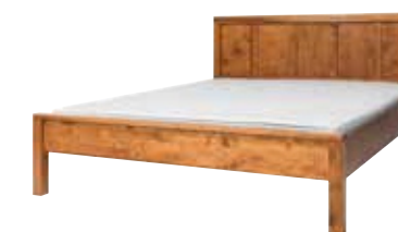
łóżko 140x200 BL142 łóżko 160x200 BL162 łóżko 180x200 BL182 szer./głęb./wys. szer./głęb./wys. szer./głęb./wys. 147/213/95 167/213/95 187/213/95