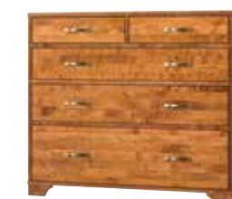
komoda szeroka CAM0300 szer./głęb./wys. 110/45/98