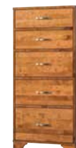
komoda wysoka 5SZ CAM0400 szer./głęb./wys. 60/45/130