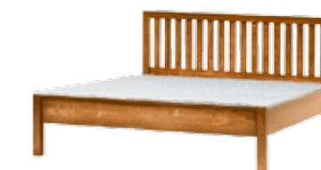
łóżko 140x200 BL140 łóżko 160x200 BL160 łóżko 180x200 BL180 szer./głęb./wys. szer./głęb./wys. szer./głęb./wys. 147/213/95 167/213/95 187/213/95