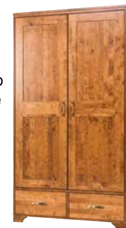
szafa 2D CAM1000 szer./głęb./wys. 110/55/199