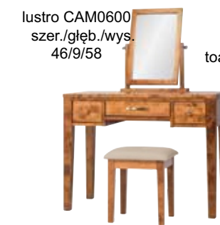
lustro CAM0600 szer./głęb./wys. 46/9/58